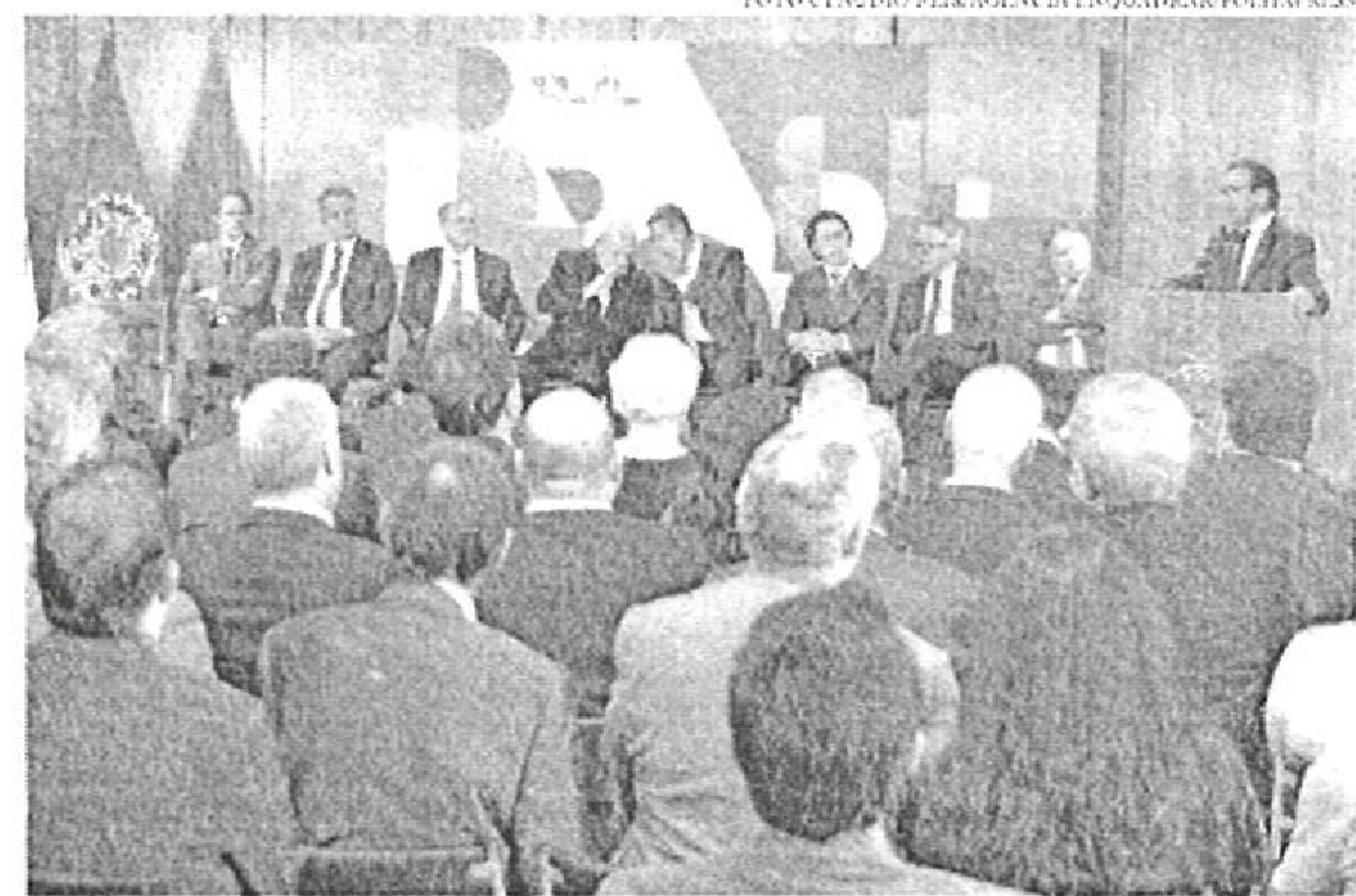
Sanção da política de valorização permanente do mínimo contou com presença de diversos políticos

Além disso, o presidente Lula enviou ao Congresso a